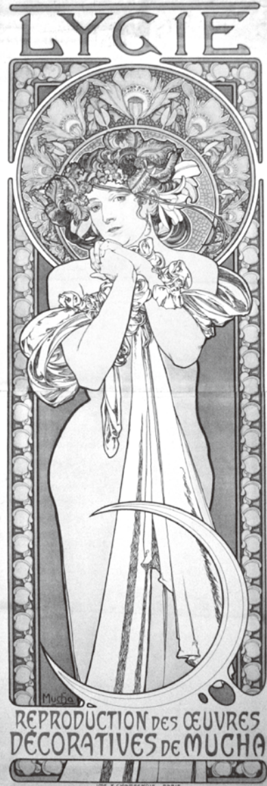
小西正太郎ポスターコレクション「LYGIE」 Alphonse Mucha