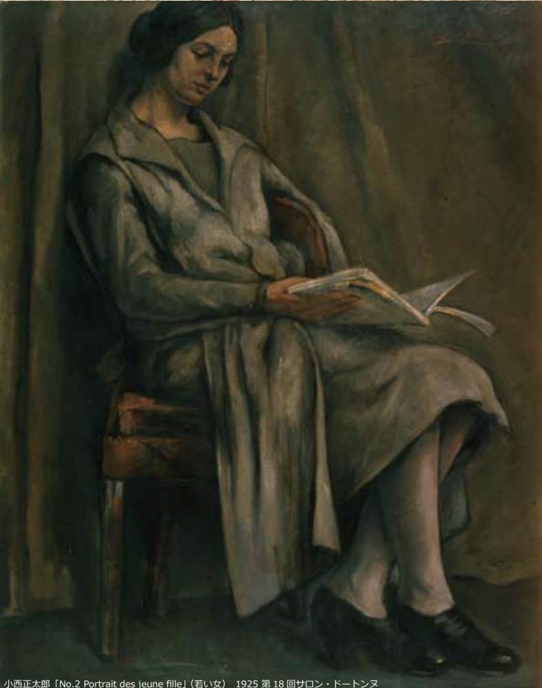
小西正太郎「No.2 Portrait des jeune fille」(若い女) 1925 第18回サロン・ドートンヌ

美郷町出身の洋画家・小西正太郎が、再起をかけて渡ったフランス時代の作品をご紹介します。女性的美を見つめ描き続けた小西の作品とともに、パリが最も熱を帯びていた時代をおたのしみください。